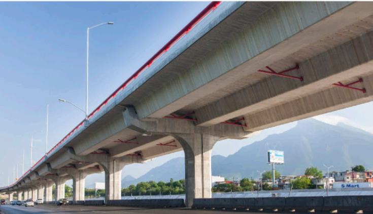
◀ PUENTE REA Monterrey, NL.