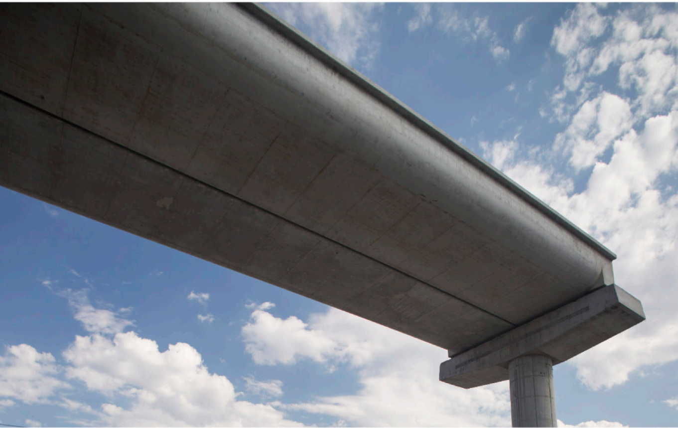
▲ LINEA 3 METRO Monterrey, NL.