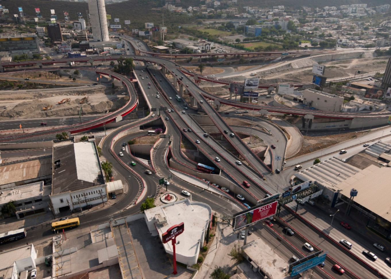
▲ DISTRIBUIDOR VIAL GONZALITOS - MORONES PRIETO Monterrey, NL.

Realizamos proyectos para un mundo más eficiente y ordenado, con mayor calidad de vida para la sociedad, generando rentabilidad y haciendo crecer a nuestros clientes.