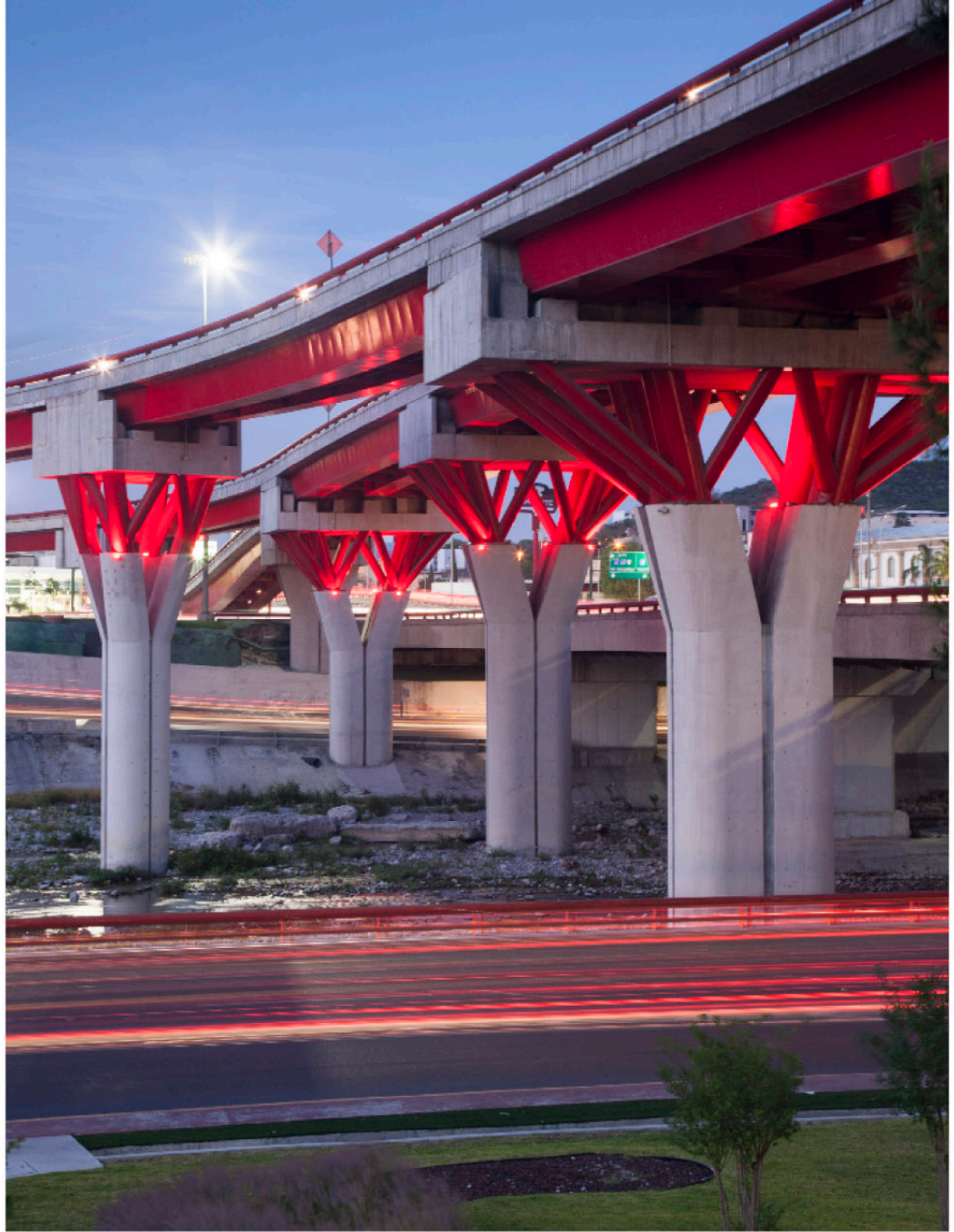
▲ DISTRIBUIDOR VIAL GONZALITOS - MORONES PRIETO Monterrey, NL.