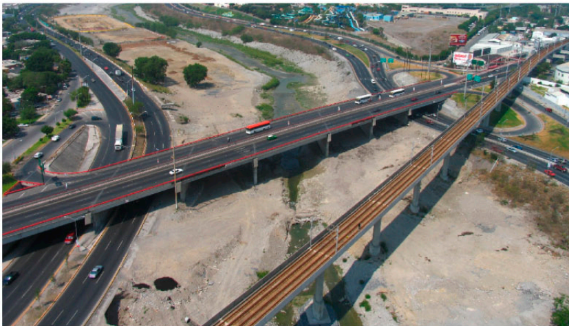
◀ PUNTE GUADALUPE Guadalupe, NL.