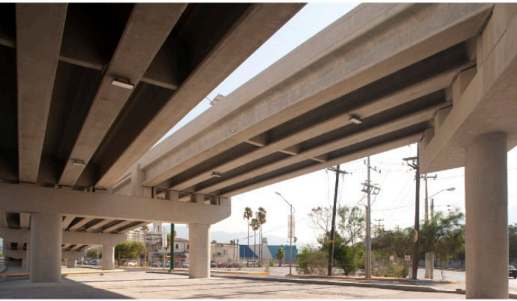
■ P.S.V. AVE ALFONSO REYES Y SERVICIO POSTAL Monterrey, NL.