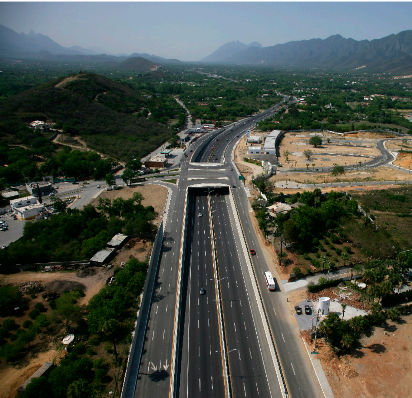
▼ PASO DEPRIMIDO EN VILLA DE SANTIAGO Santiago, NL.