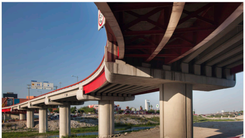
PUENTE ZARAGOZA ▶ Monterrey, NL.