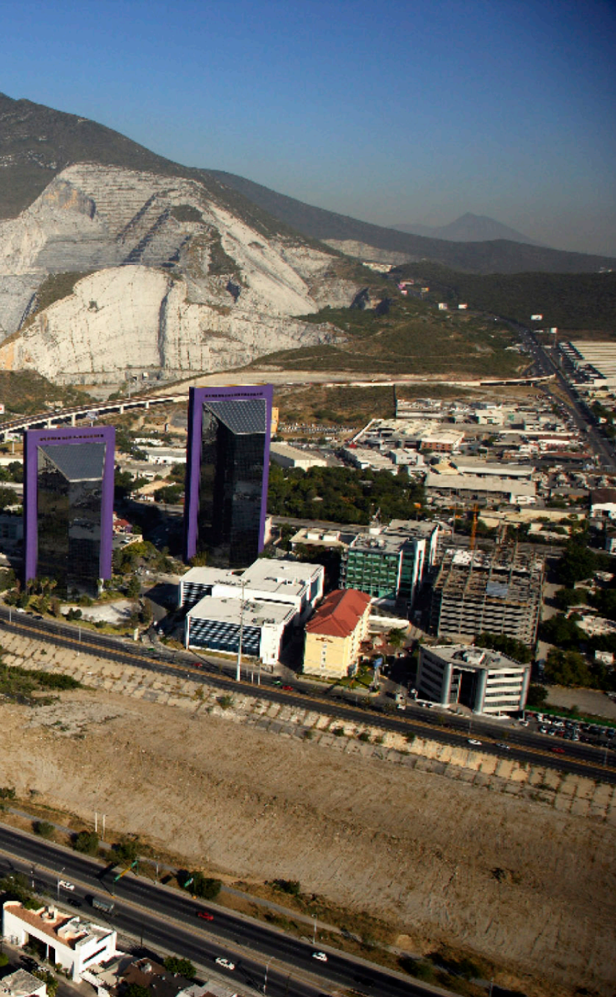
VIADUCTO LA UNIDAD Monterrey, NL.

Constructura Moyeda es el más sólido desarrollador de infraestructura en el país. La empresa construye obras públicas - privadas de vital importancia económica - social con gran eficiencia y rentabilidad.