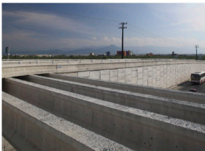
◀ RETORNO SOBRE CARRETERA ZUAZUA Apodaca, NL.