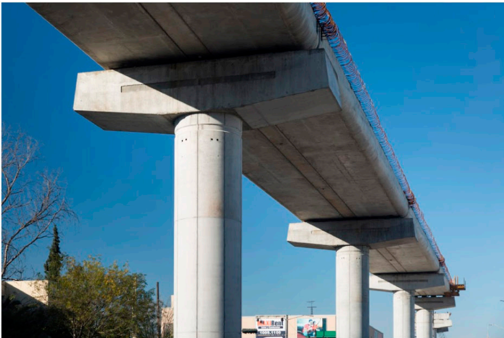
◀ LINEA 3 METRO Monterrey, NL.