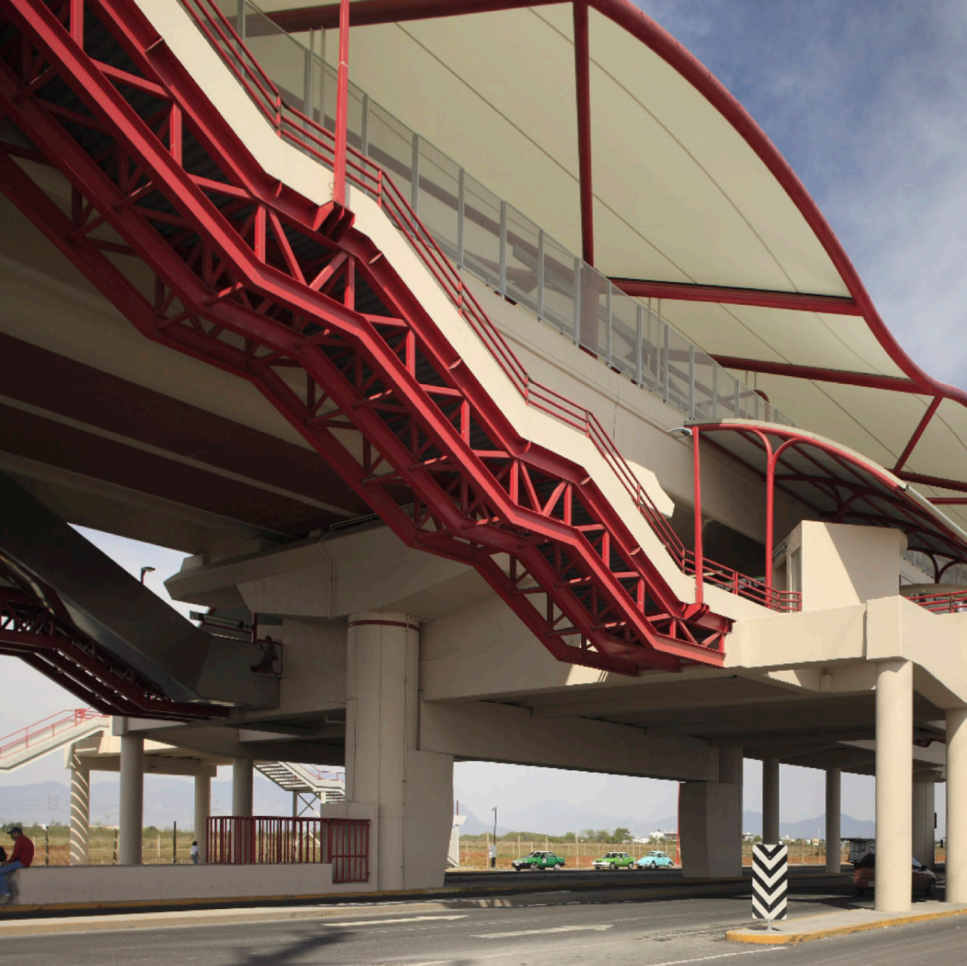
▲ ESTACIÓN SENDERO - METRORREY LÍNEA 2 San Nicolás de los Garza, NL.

Nuestra experiencia se basa en la construcción de carreteras, puentes, hospitales, centros penitenciarios, plantas industriales, edificios administrativos, proyectos IPC, túneles, desarrollo de infraestructura bajo diferentes modalidades de contratación y prestación de servicios para el mercado costa afuera, entre otros.