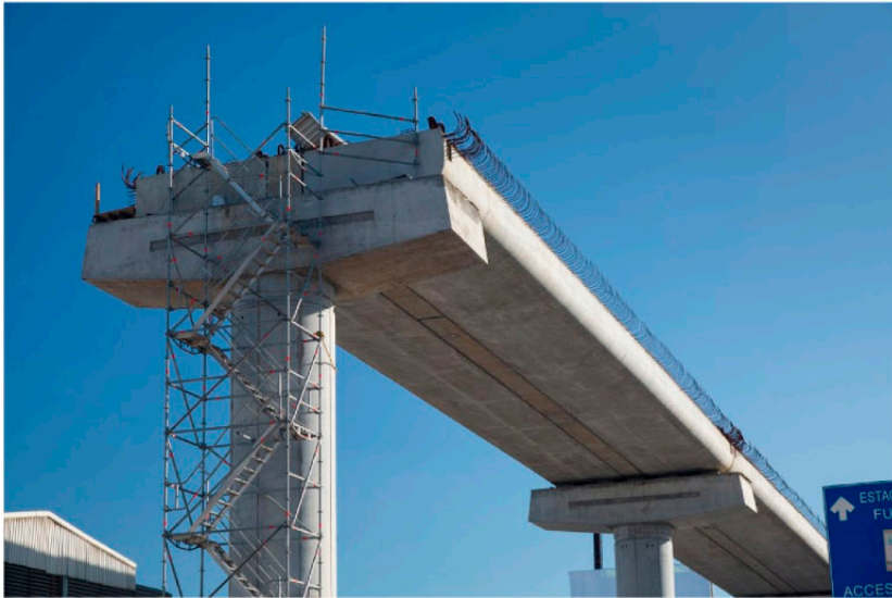
▲ LINEA 3 METRO Monterrey, NL. ▼