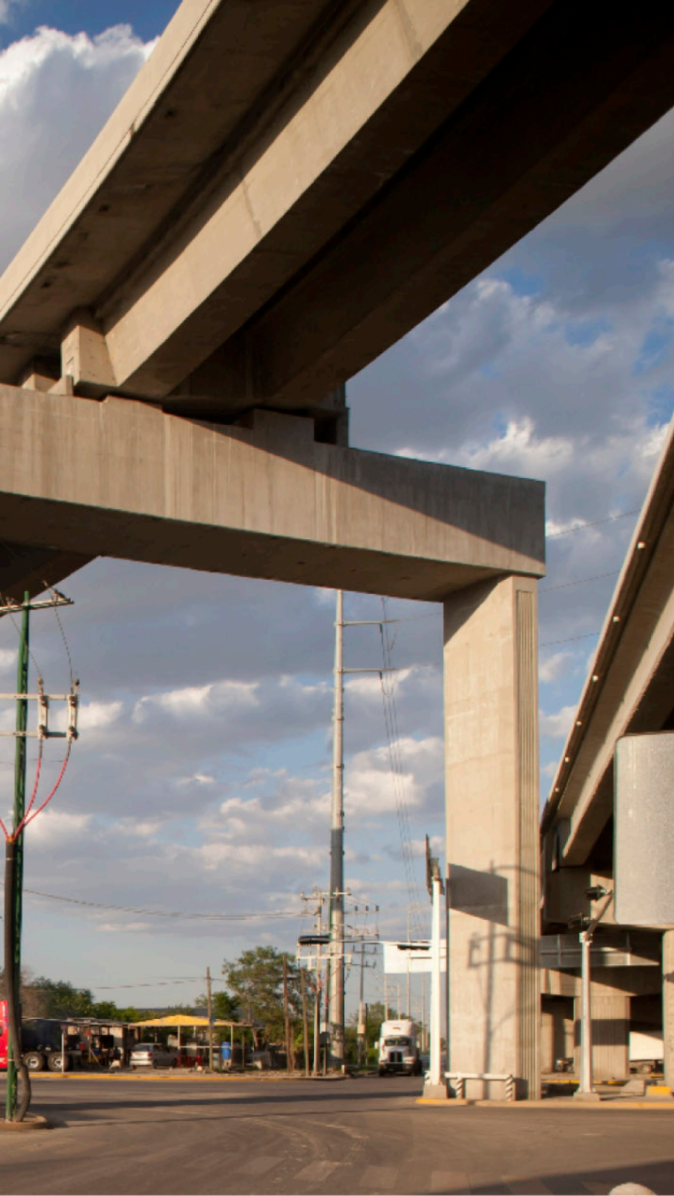
◀ PASO A DESNIVEL LIBRAMIENTO NORESTE SEGUNDO PISO Escobedo, NL.