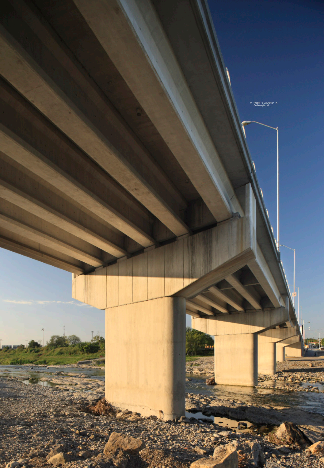
▼ PUENTE CADEREYTA Cadereyta, NL.