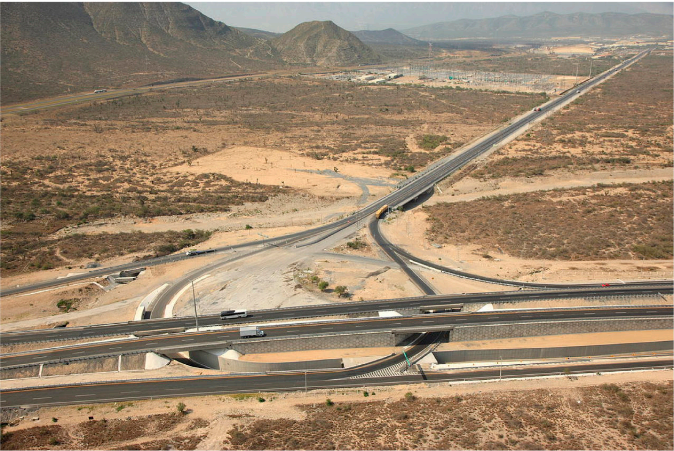
PASO A DESNIVEL LIBRAMIENTO NORESTE Y CARRETERA SALTILLO Santa Catarina, NL. ▲