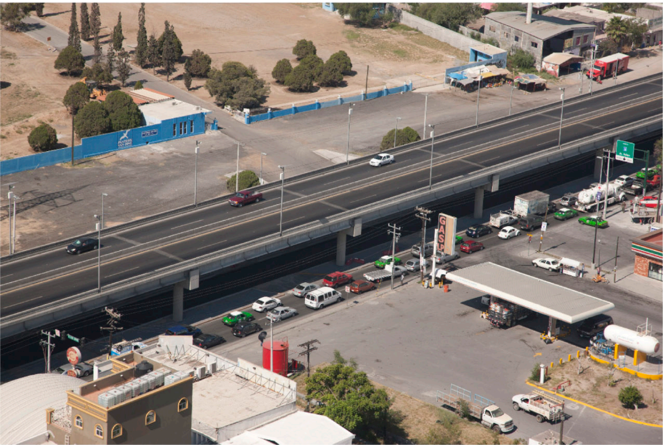
▲ PASO A DESNIVEL LINCOLN Y RUIZ CORTINEZ Monterrey, NL.