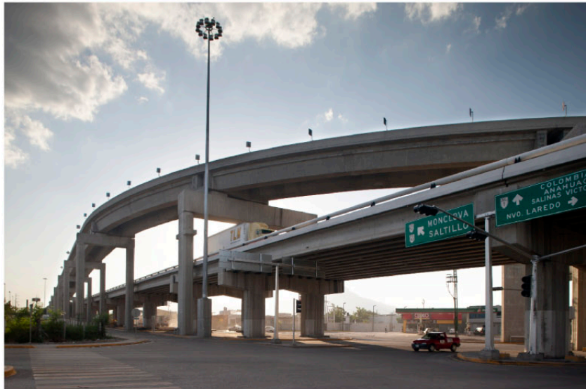
▲ PASO A DESNIVEL LIBRAMIENTO NORESTE SEGUNDO PISO Escobedo, NL.