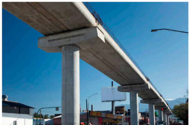
LINEA 3 METRO ▲ Monterrey, NL.

Realizamos proyectos para un mundo más eficiente y ordenado, con mayor calidad de vida para la sociedad, generando rentabilidad y haciendo crecer a nuestros clientes.