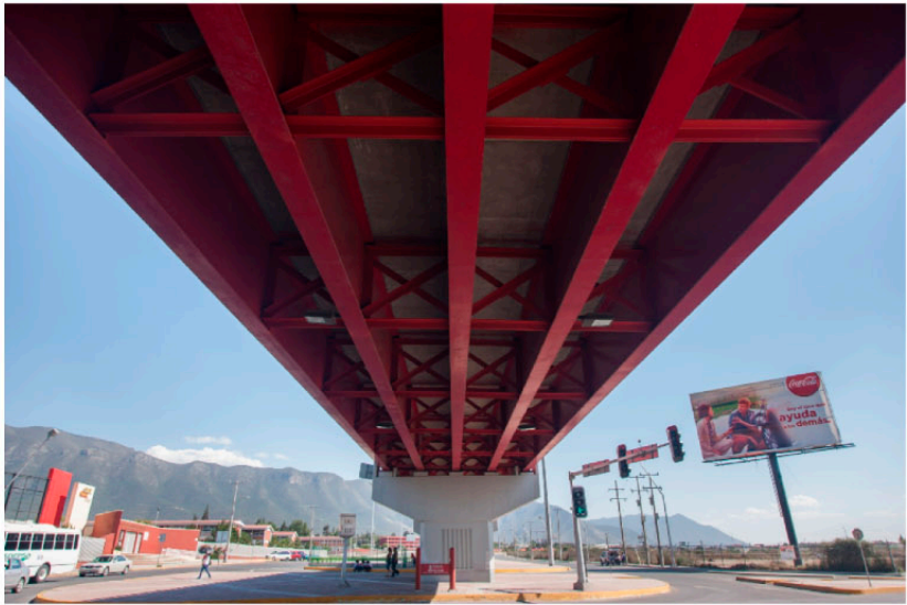
DISTRIBUIDOR VIAL VALLE DORADO ▲ Saltillo, Coah.