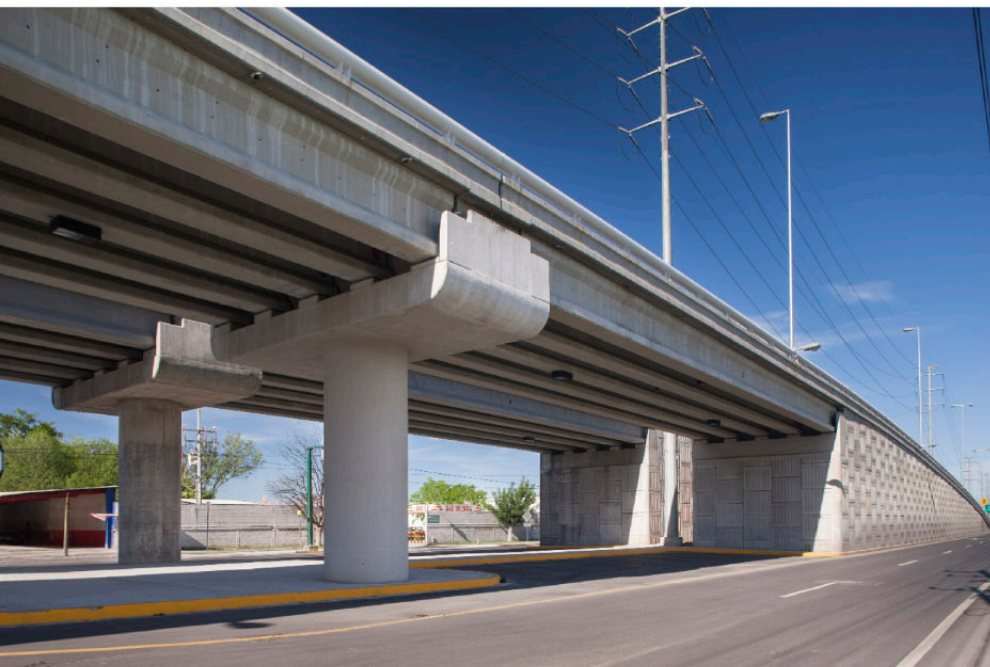
◀ PUENTE SENDERO Escobedo, NL.